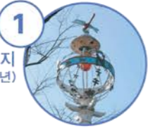
1 잠자리 표지 (1930년)