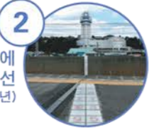
2 히토마루마에 지역의 자오선 (1991년)