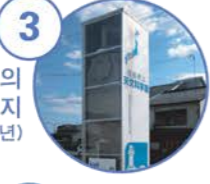
3 국도 2호선의 표지 (1933년)