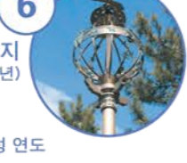
6 잠자리 표지 (모조품) (1984년)