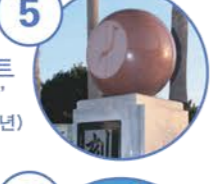
5 모뉴먼트 '시각' (1989년)