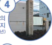
4 최초의 표지 (1910년)