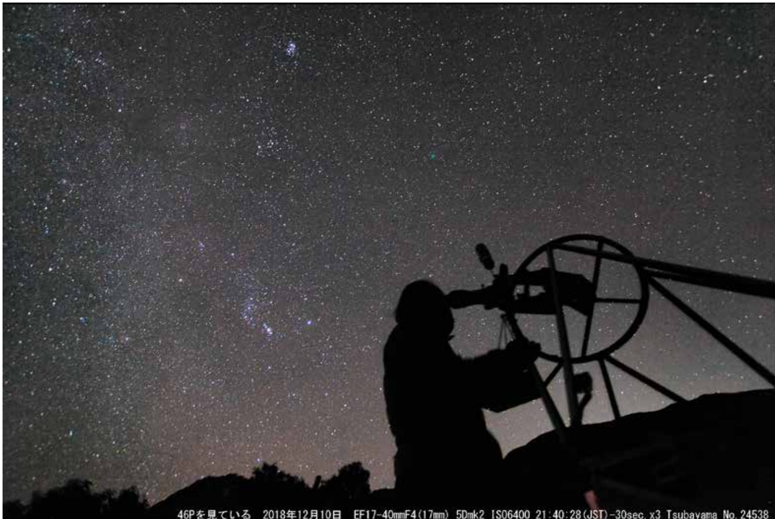
46Pを見ている 2018年12月10日 EF17-40mmF4(17mm) 5Dmk2 ISO6400 21:40:28(JST)-30sec.x3 Tsubayama No.24538