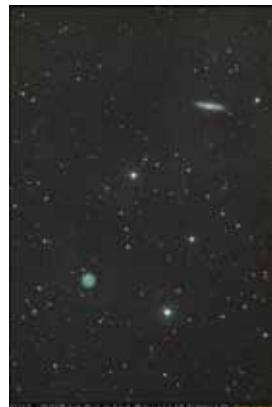
⑤M97 と M108