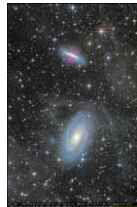
⑥M81 と M82 銀河