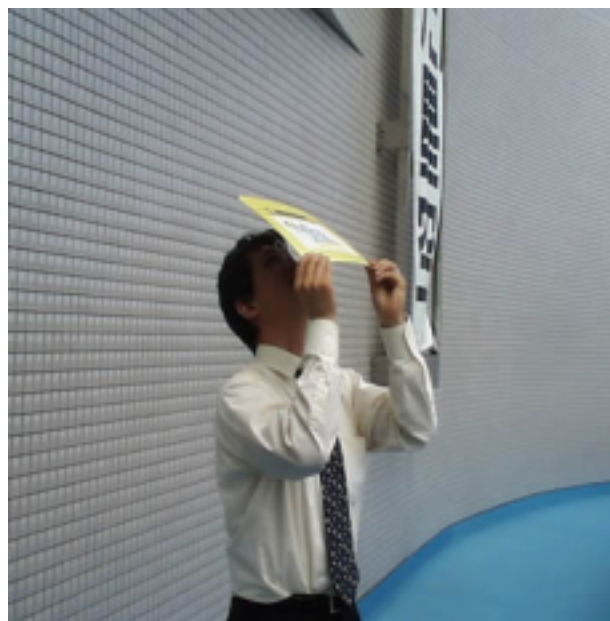
サンマスクで太陽を見てみましょう。くっきりと太陽の輪郭がわかります。